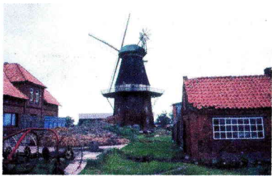
Die Mühle mit Grundstück ca. im Jahr 1980. Das Wohnhaus links wurde nach 2 Bränden abgerissen.

Die Mühle hatte eine Bockwindmühle als Vorgängerin, die 1870 abbrannte. Der 1872 erbaute Galerieholländer hat schon einiges erlebt und wurde leider früh stillgelegt. Die letzten Besitzer konnten die für die Restaurierung notwendigen Geldmittel nicht beschaffen und verließen Blender in den 90er Jahren. Das Grundstück und die Mühle waren lange sich selbst überlassen und verfielen, bis sich eine Interessengemeinschaft zur Erhaltung der Mühle fand. Der Mühlenförderkreis wurde gegründet, und hiermit eine Grundlage zur Erhaltung der Mühle geschaffen. Nach langwierigen Verhandlungen und vielen Gesprächen ist man heute dankbar, dass diese Initiative erfolgreich war und die Mühle zu dem wurde, was sie heute ist - ein Schmuckstück der Region. Ermöglicht wurde dies durch die gute Zusammenarbeit zwischen dem jetzigen Besitzer, Herrn Dr. R. Lüdemann, den Vertretern des MFK und den behördlichen Stellen sowie zahlreicher Sponsoren, für die in der Mühle eine „Dankestafel“ aufgehängt wurde.